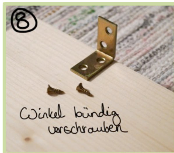
Bild 7 + 8 Winkel bündig auf alle Seitenwände schrauben. Der Abstand muss nicht genau abgemessen werden, ungefähr wie auf Bild 7 anordnen.