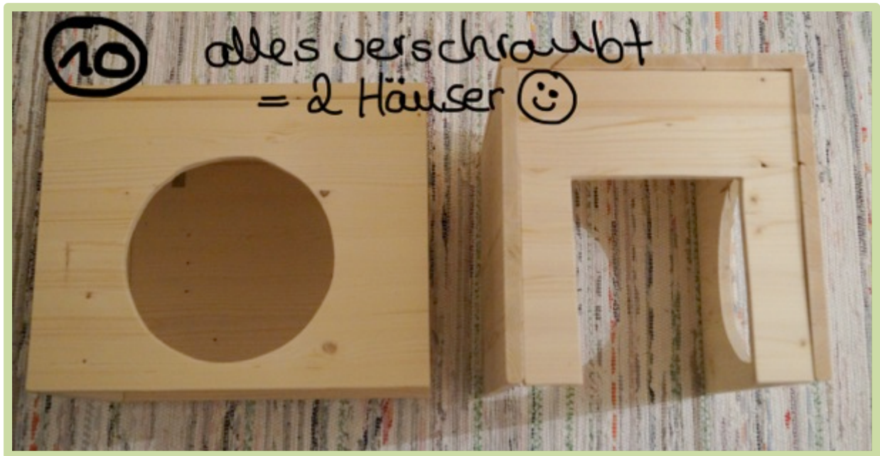
Bild 10 Wenn alles verschraubt ist, haben wir zwei Häuschen.