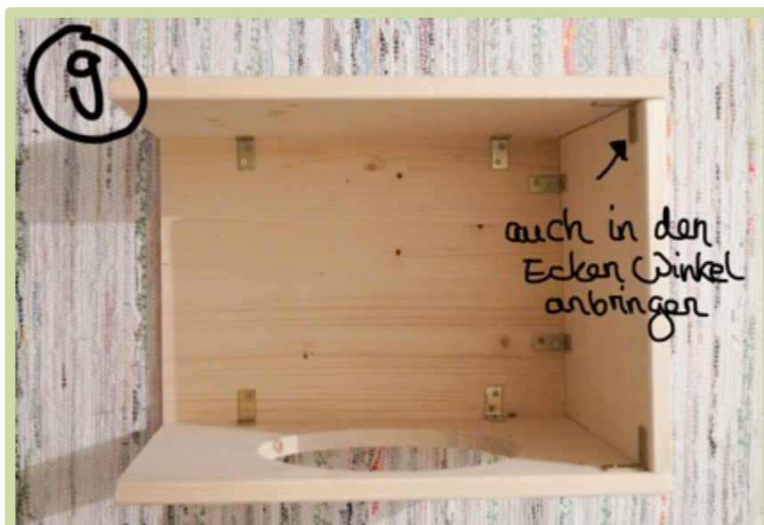
Bild 9 1 Dach (30x40 cm) auf den Boden legen und bündig die kurze Seitenwand an die kurze Seite schrauben. An die langen Seiten jeweils eine lange Seitenwand und ein Tunnelstück schrauben.

In den Ecken zur besseren Stabilität auch jeweils einen Winkel anschrauben.